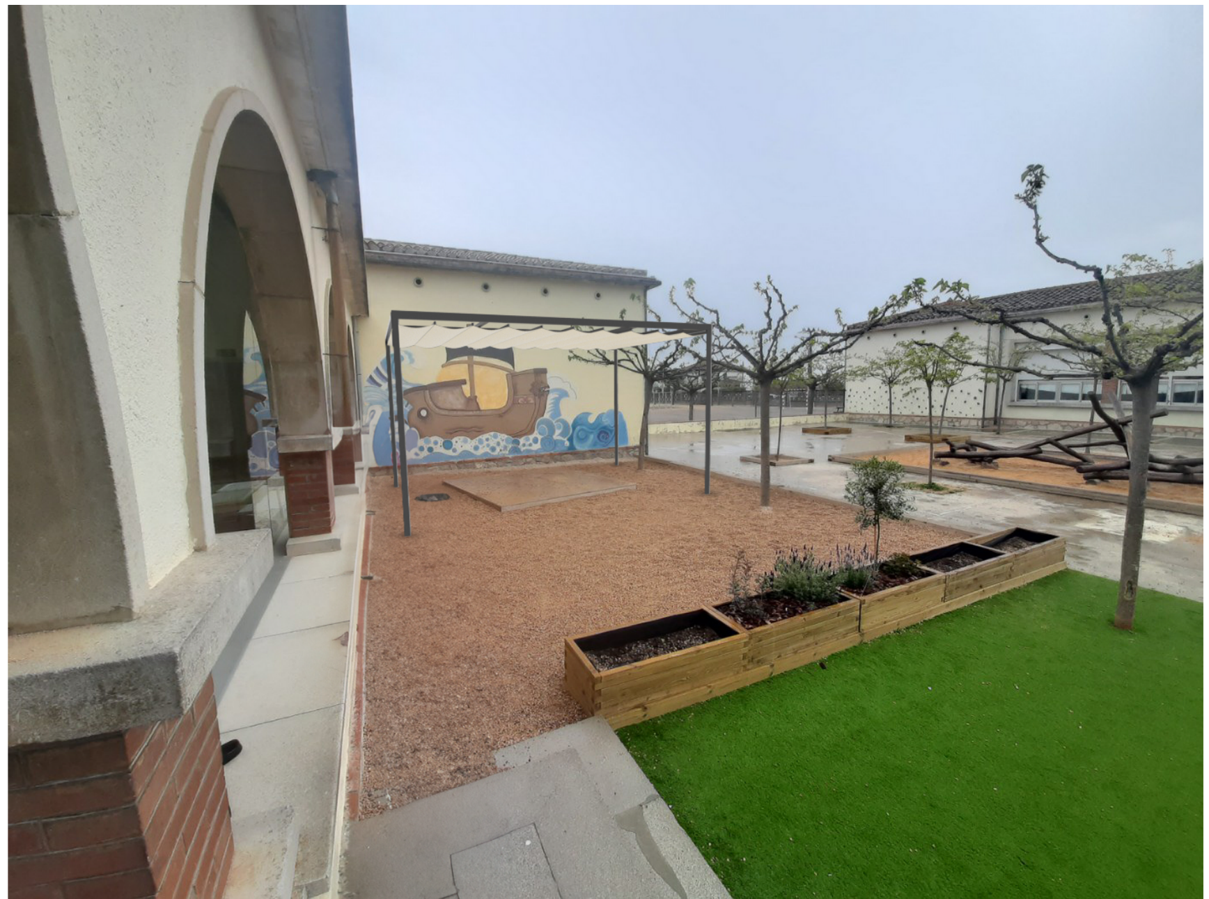
INFOGRAFIA 3D + FOTO

Escola Puig d'Arques - Zona pati interior sorrer