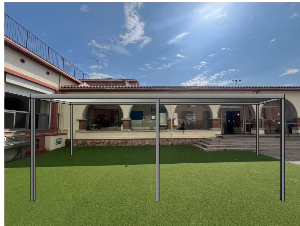
IMATGE ZONA PATI

Escola Puig d'Arques - Zona pati gespa artificial